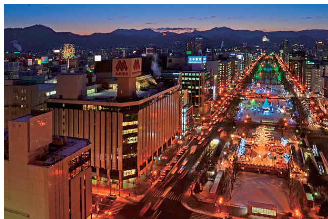
さっぽろホワイトイルミネーションの様子